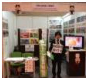
大阪 MOBAC でのブースです！ HBP もブースを出します！