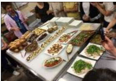
全部美味しいお料理でした！