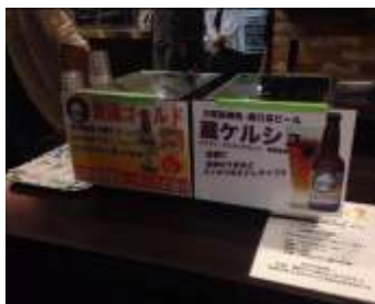
どちらもサーバーから生ビールでいただきました。壽酒造の方が注いでくださいます。