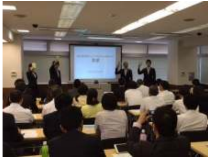
地方大会でのプレゼンテーション！