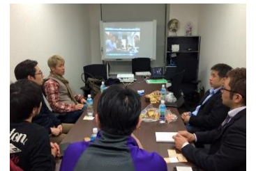
東京会場の様子です。

(株)PAN.Labo 東京営業所 (東京都港区虎ノ門 2-7-5 BUREX 虎ノ門会議室)