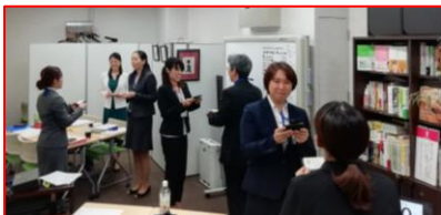
期待塾 第4講の様子