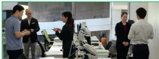
翌日社内でも共有。学んだらすぐ実践！