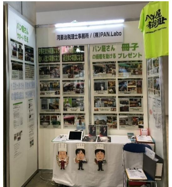
このようなブースになる予定です