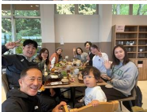
長居公園内レストランでランチ