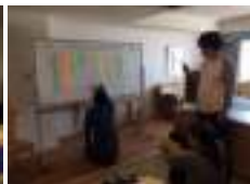
部屋にホワイトボードを持ち込んで更に議論!