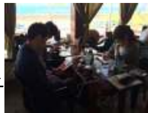
写真上: 素敵な場所で美味しいものを食べるとアイデアも湧いてきます(^_^)v 写真左: この機会に、いつもは行けないパン屋さんを訪問することもできます。