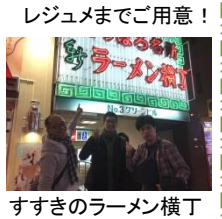
レジュメまでご用意！