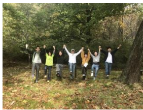
手を繋いでヨガのポーズ！

最終日の朝には、登別の地獄谷に行ってきました。まずは地獄谷周辺にある鬼の石像のもとへ。商売繁盛、学業成就、恋愛成就と色々な鬼にご挨拶しました。そして地獄谷。広がる大地と、立ち上る湯気の迫力は圧巻！周辺の山々も紅葉が始まっており、自然の壮大さを堪能することができました。そして私達は展望台を目指して長い階段を上ることに。道中ではヨガのポーズで写真を撮るパシャリ。親切な観光客の方に撮って頂きました。厳しい道のりでしたが、全員で登り切った達成感は特別なものでした。(國吉 桂)