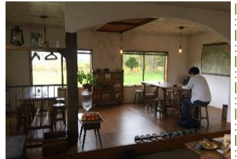
落ち着く空間に癒されました

印象的でした。2件目はソーケシュ製パン×トモエコーヒー。店内がとても落ち着く空間で、一つのテーブルを囲んでみんな