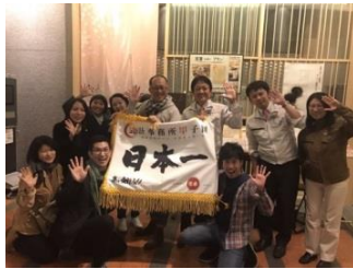
会計甲子園日本一の旗で記念撮影