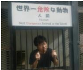
危険も楽しめます。猛禽類も手懐けます。百獣の王！！ でも一番危険なのは…

最終日の朝には、登別の地獄谷に行ってきました。まずは地獄谷周辺にある鬼の石像のもとへ。商売繁盛、学業成就、恋愛成就と色々な鬼にご挨拶しました。そして地獄谷。広がる大地と、立ち上る湯気の迫力は圧巻！周辺の山々も紅葉が始まっており、自然の壮大さを堪能することができました。そして私達は展望台を目指して長い階段を上ることに。道中ではヨガのポーズで写真を撮るパシャリ。親切な観光客の方に撮って頂きました。厳しい道のりでしたが、全員で登り切った達成感は特別なものでした。(國吉 桂)