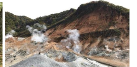
広がる地獄谷。熱気を感じてきました。