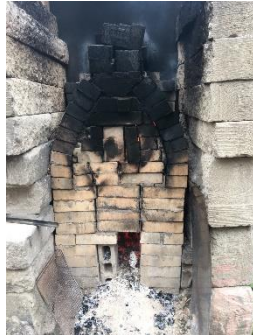
外から見た窯の様子

今回の北海道旅行では、事前に行きたいお店をリストアップして訪問してきました。1件目はヴェルジノバッカーノ。薪窯が特徴で、パンにも燻製されたような香りが移っているのが