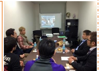
東京会場の様子です。

東京会場: 参加費 1,000 円 (株)PAN.Labo 東京営業所 (東京都港区虎ノ門 2-7-5 BUREX 虎ノ門会議室) 5月28日(月)、6月25日(月)